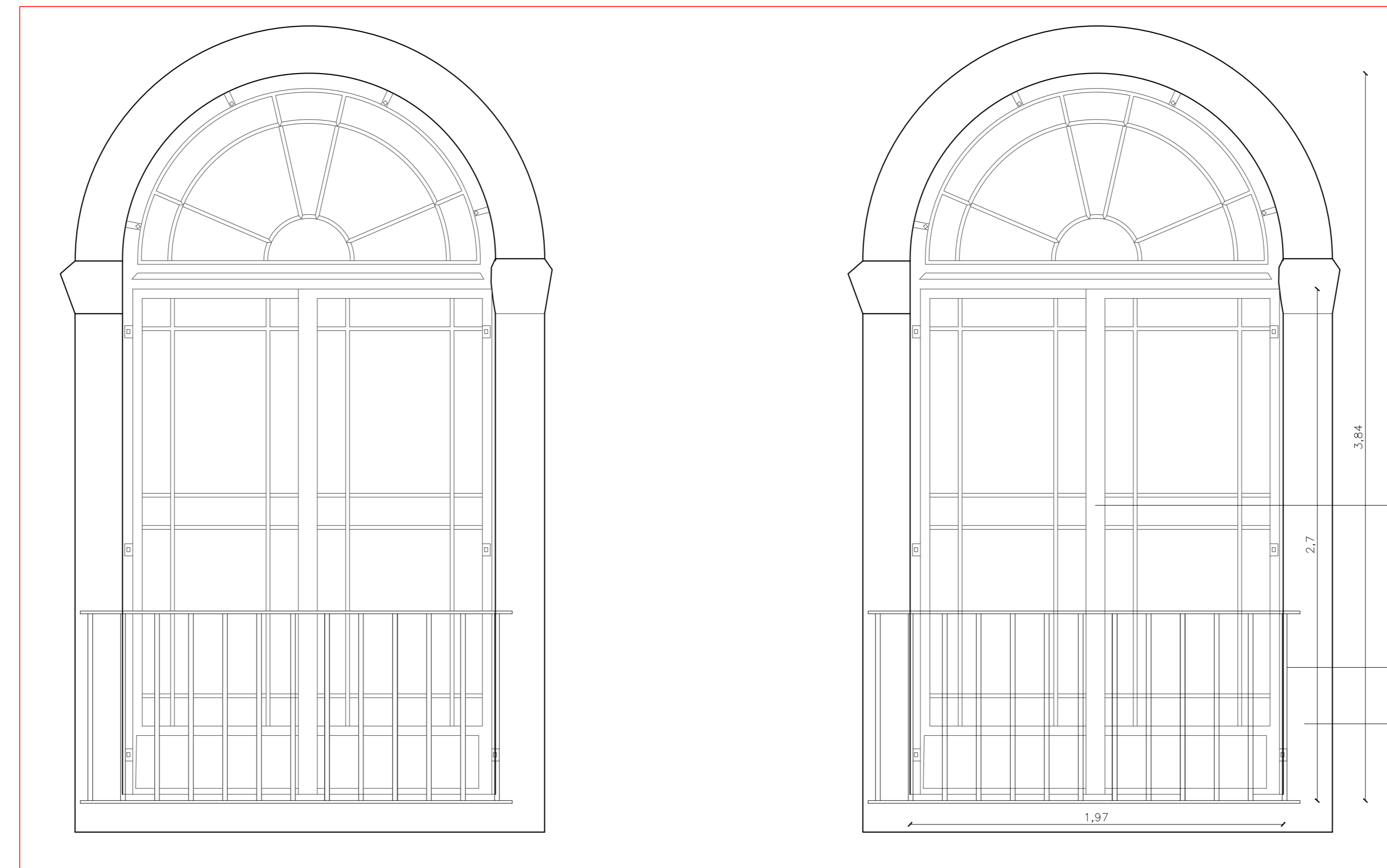
DETTAGLIO FACCIATA VANO SCALA_scala 1:20